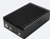
Available 220V System Benchtop Amplifier